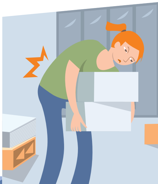
DOULEURS AU DOS